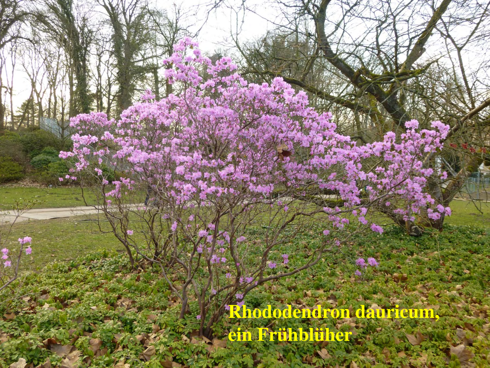
Rhododendron dauricum, ein Frühblüher