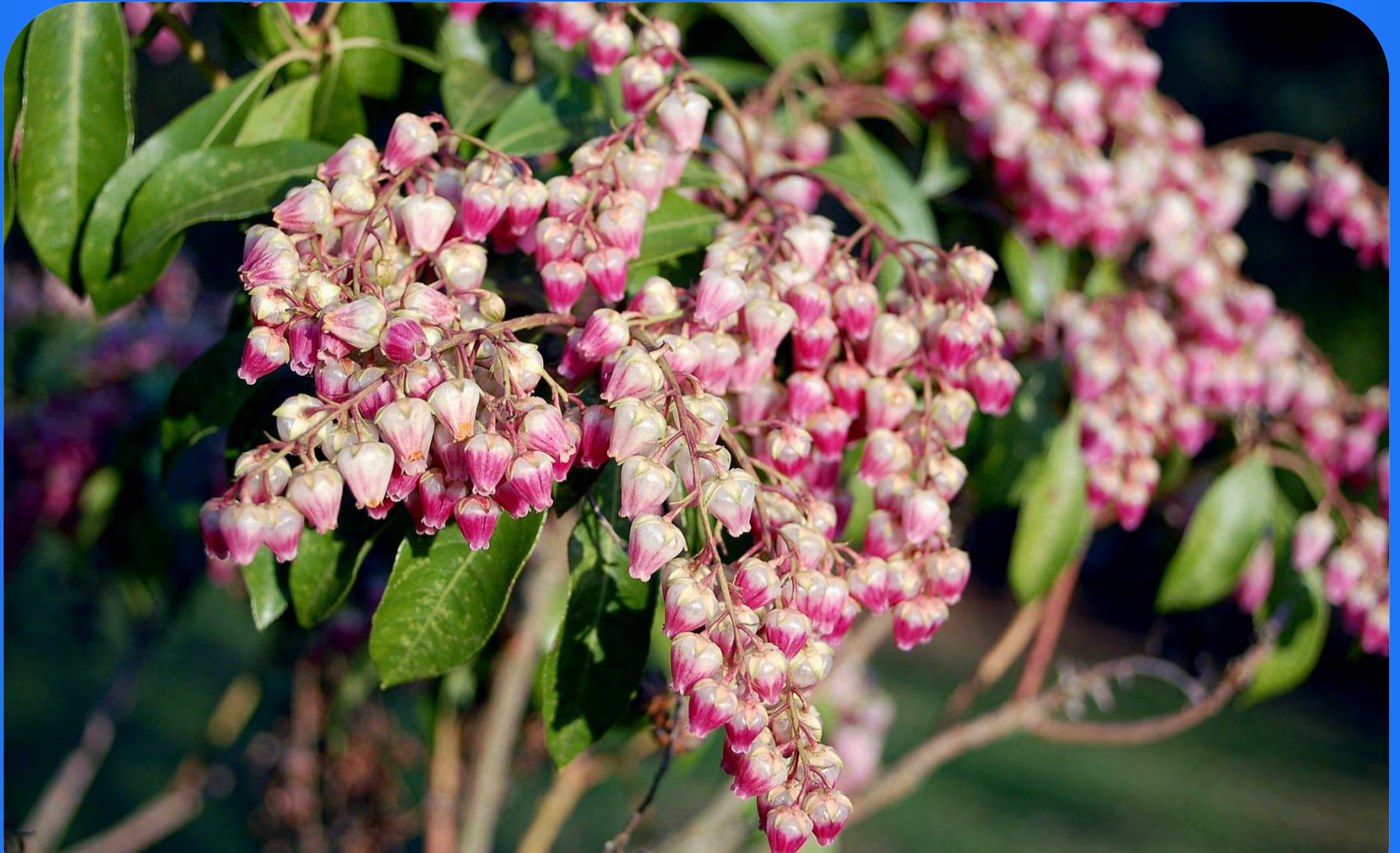
Pieris japonica „Valley valentine“ Eine der Lavendel-Heidearten in voller Blüte.