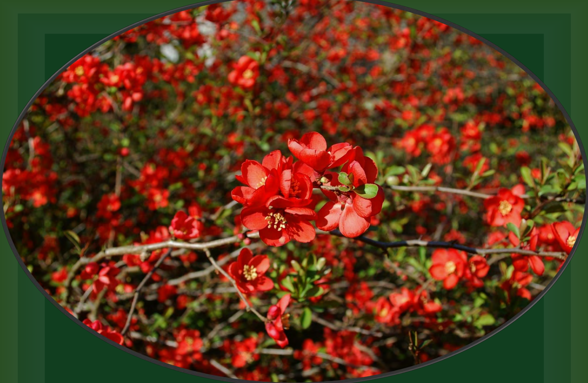
Japanische Scheinquitten im Clematisgarten, eines von ca. 4500 Ziergehölzen im Botanischen Garten Rombergpark