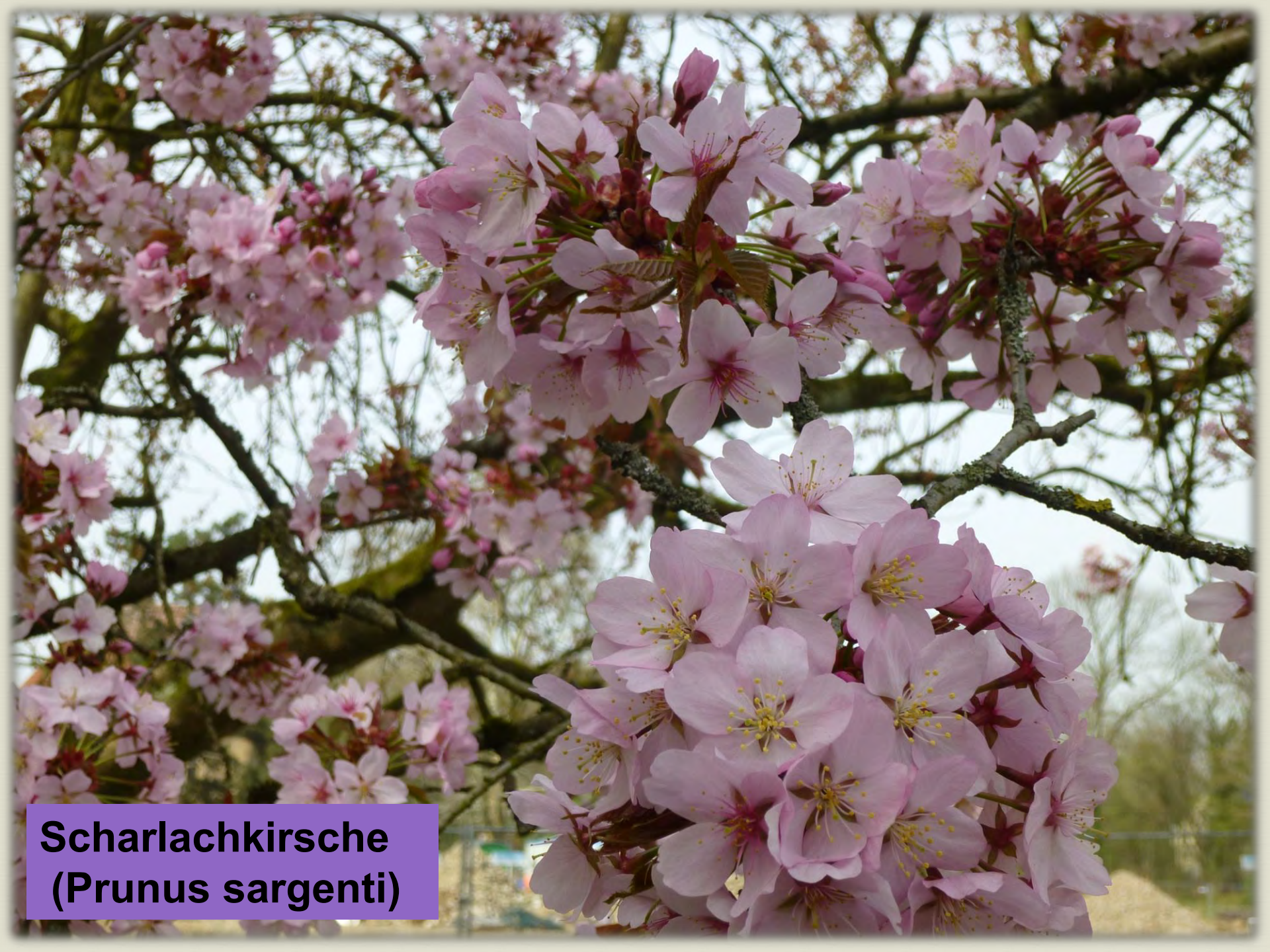
Scharlachkirsche ( Prunus sargentii )