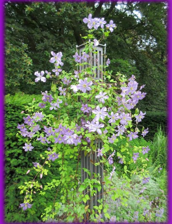
Waldreben im Clematisgarten