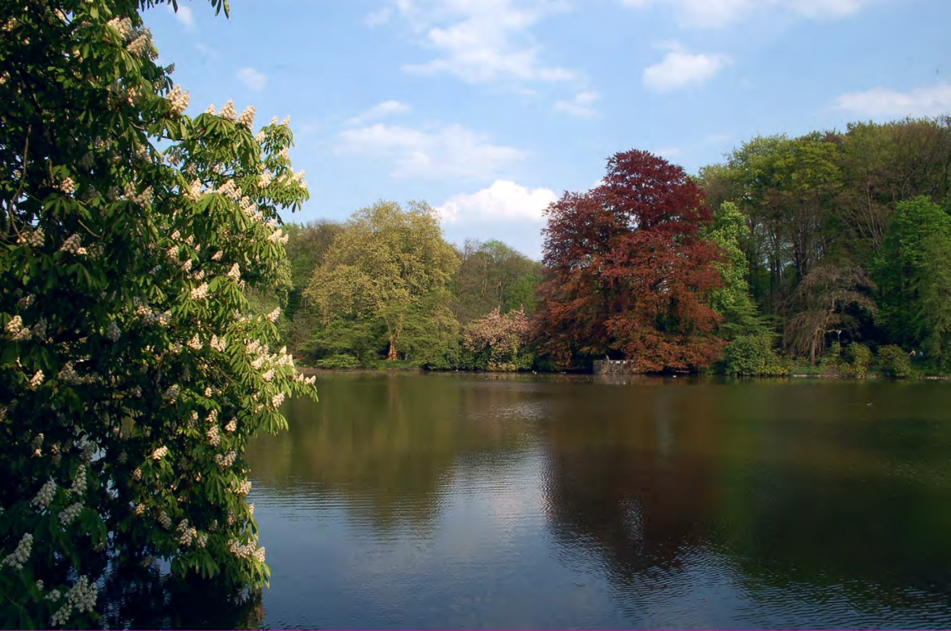
Der Schloßteich im Rombergpark mit der großen Blutbuche