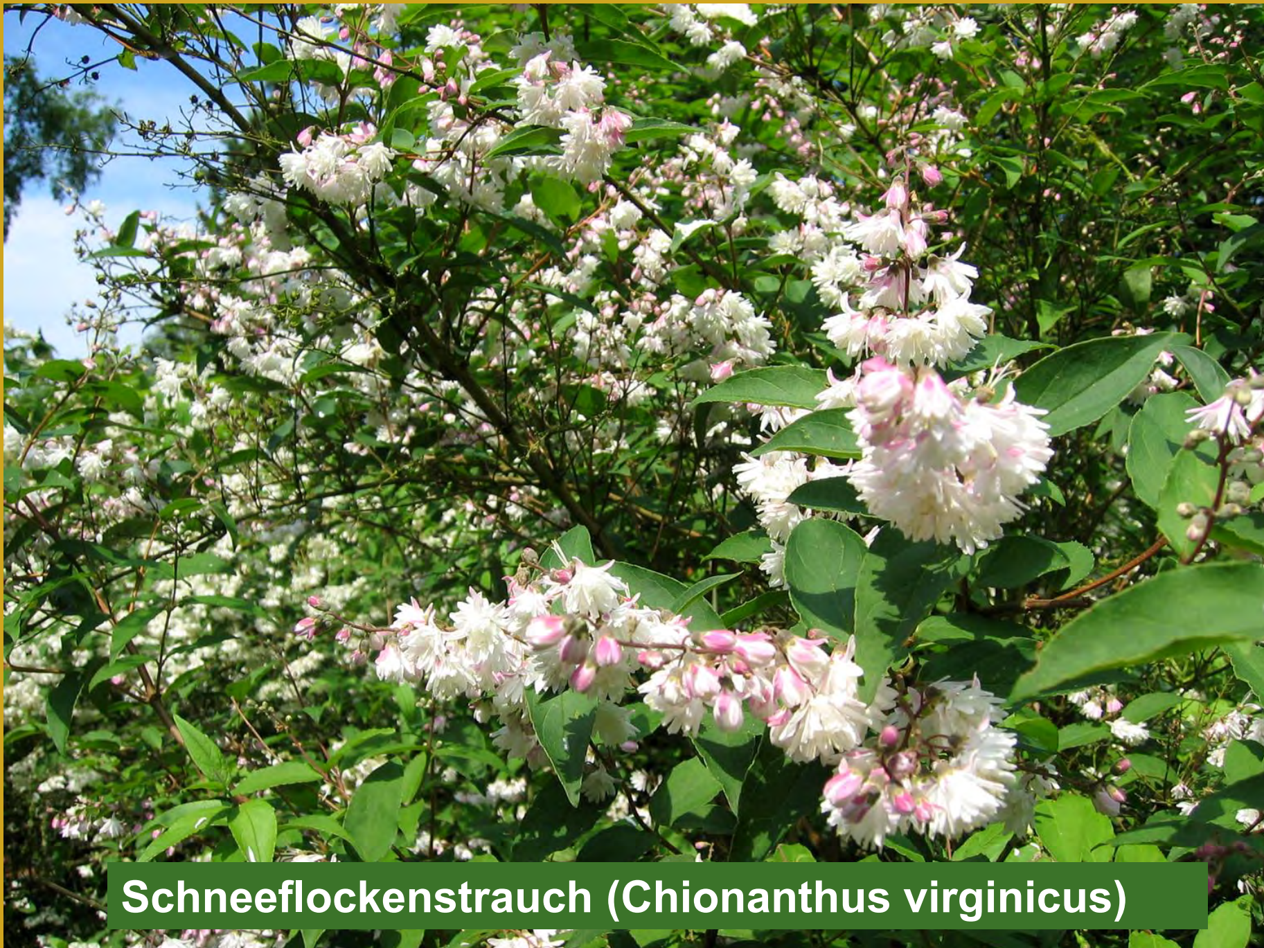
Schneeflockenstrauch (Chionanthus virginicus)