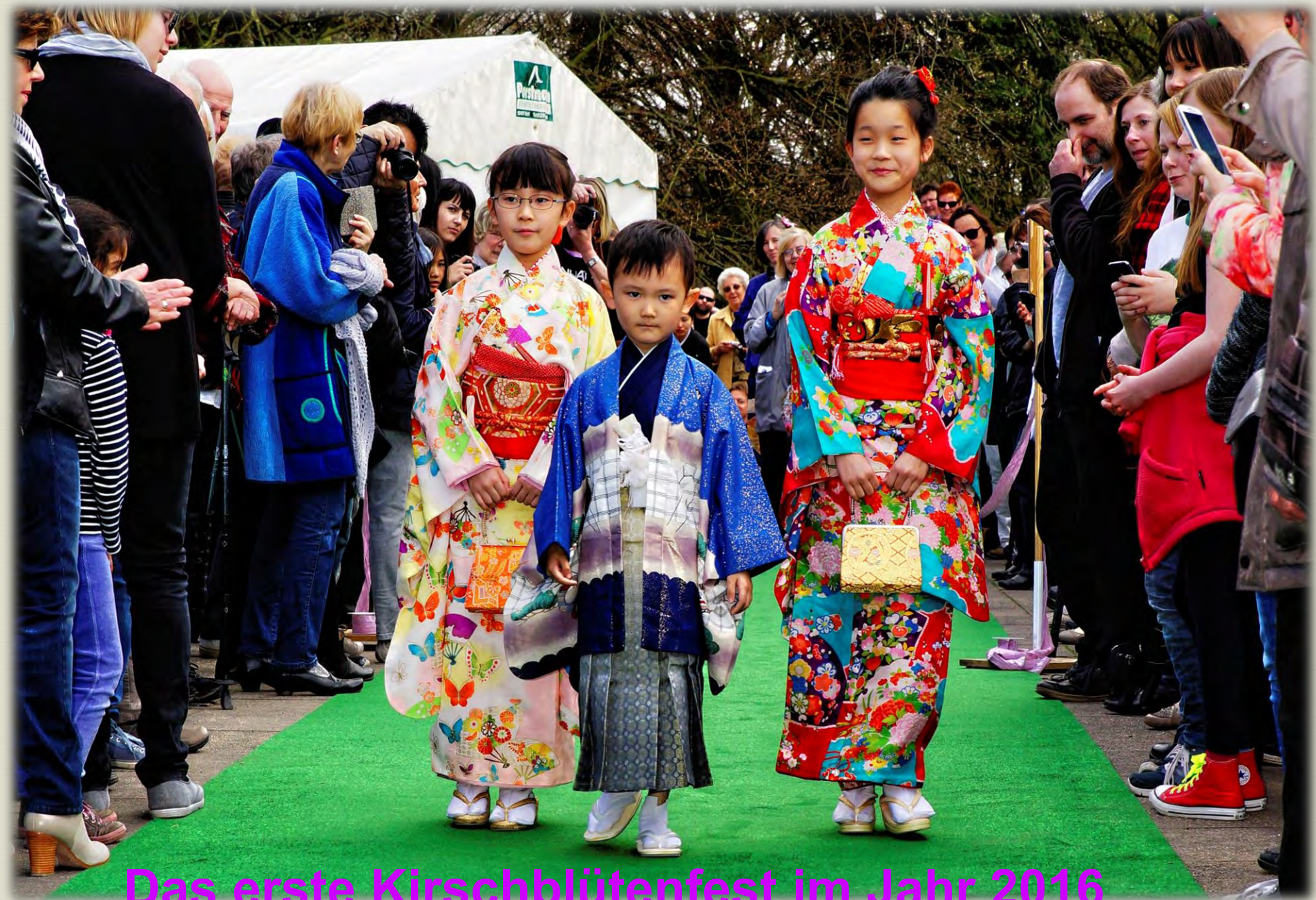
Das erste Kirschblütenfest im Jahr 2016