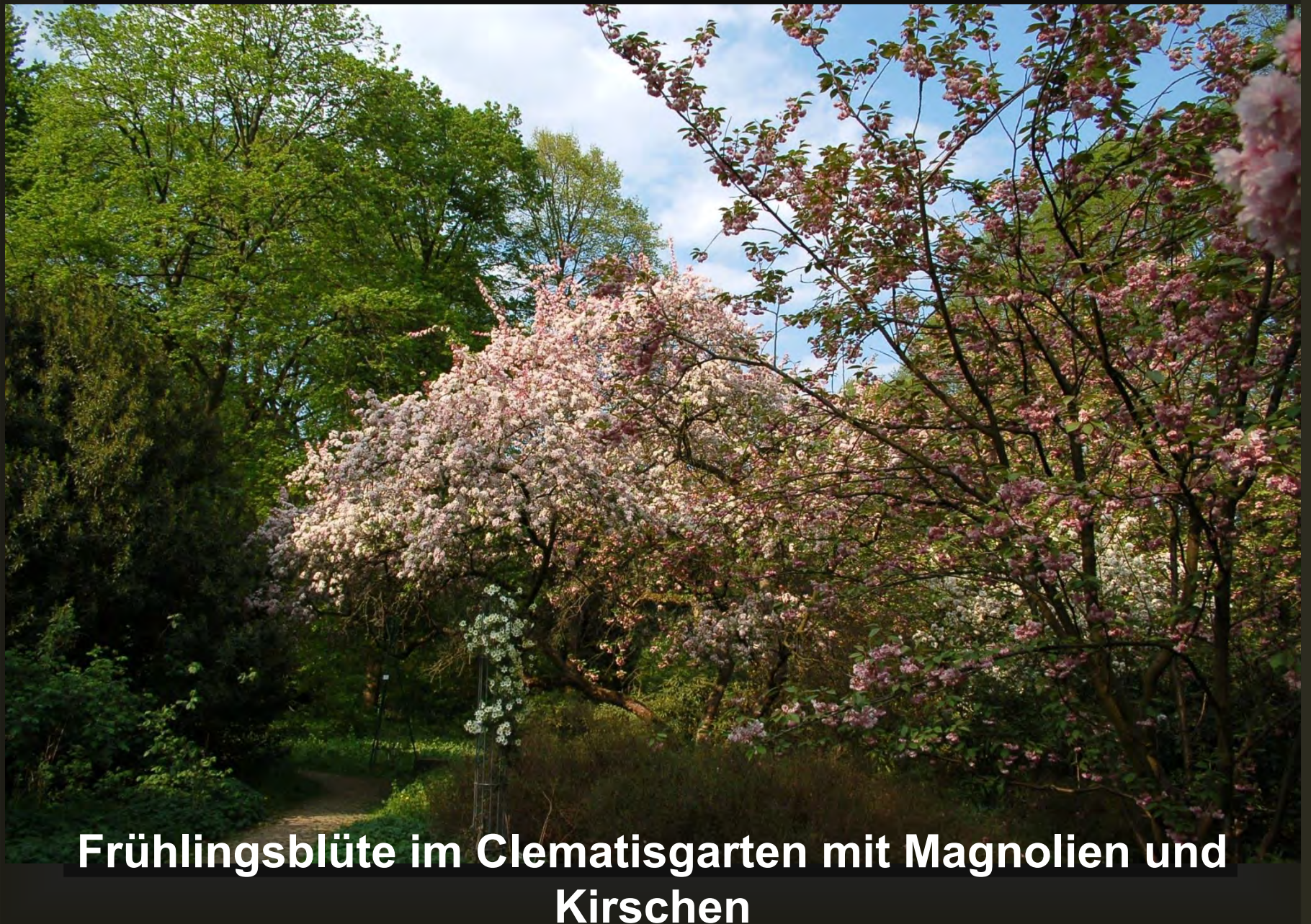
Frühlingsblüte im Clematisgarten mit Magnolien und Kirschen