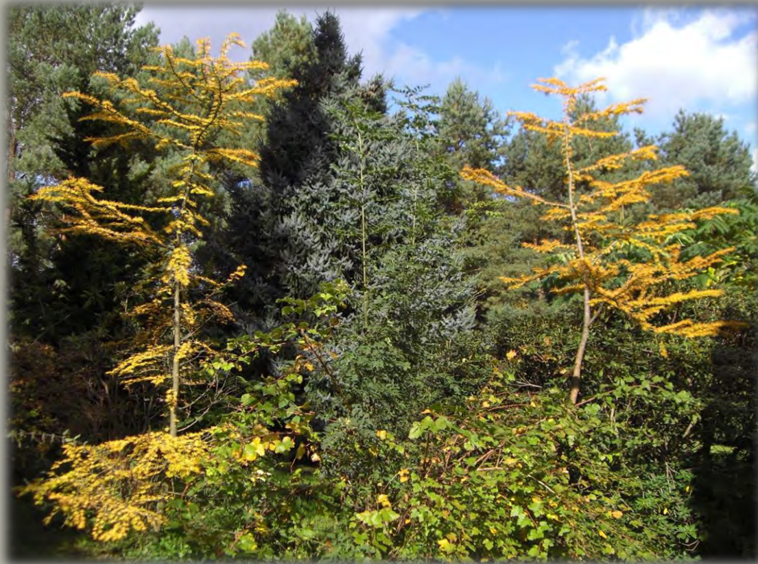
Die herbstlich gefärbten Zweige der Chinesischen Goldlärche ( pseudolarix amabilis ) „Scheinlärche“