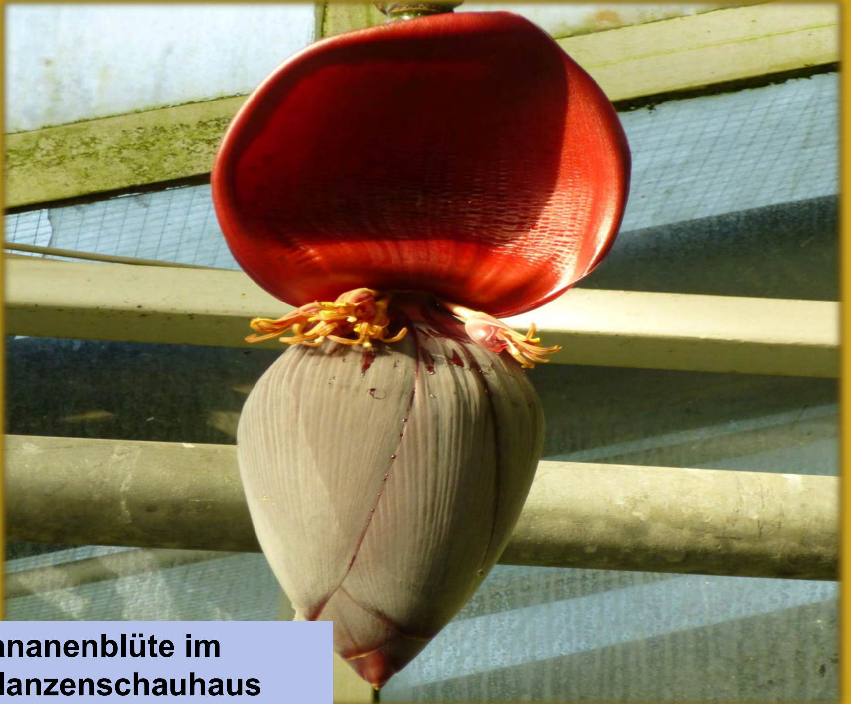
Bananenblüte im Pflanzenschauhaus