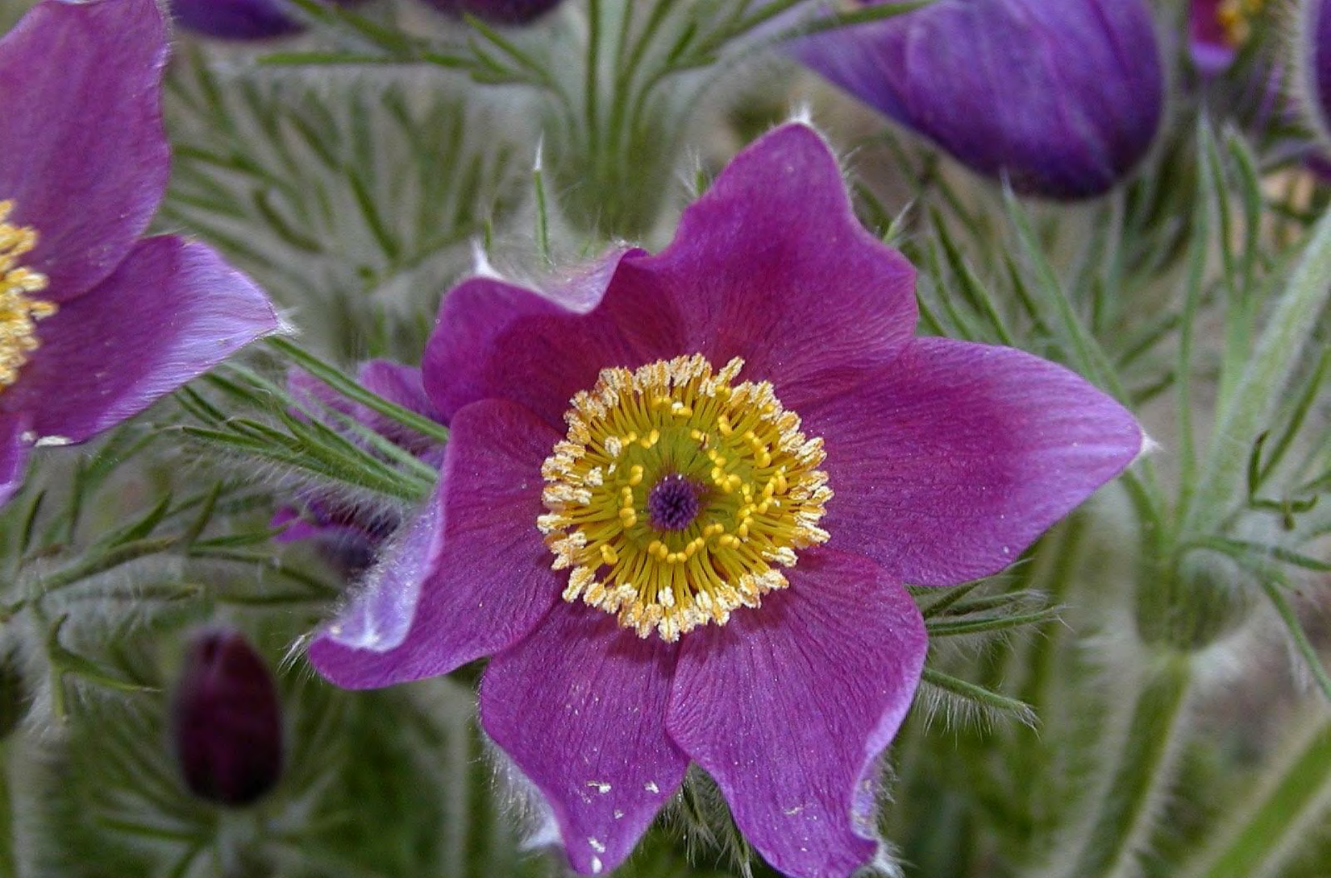
Küchenschelle ( Pulsatilla vulgaris ) im Loki-Schmidt-Garten