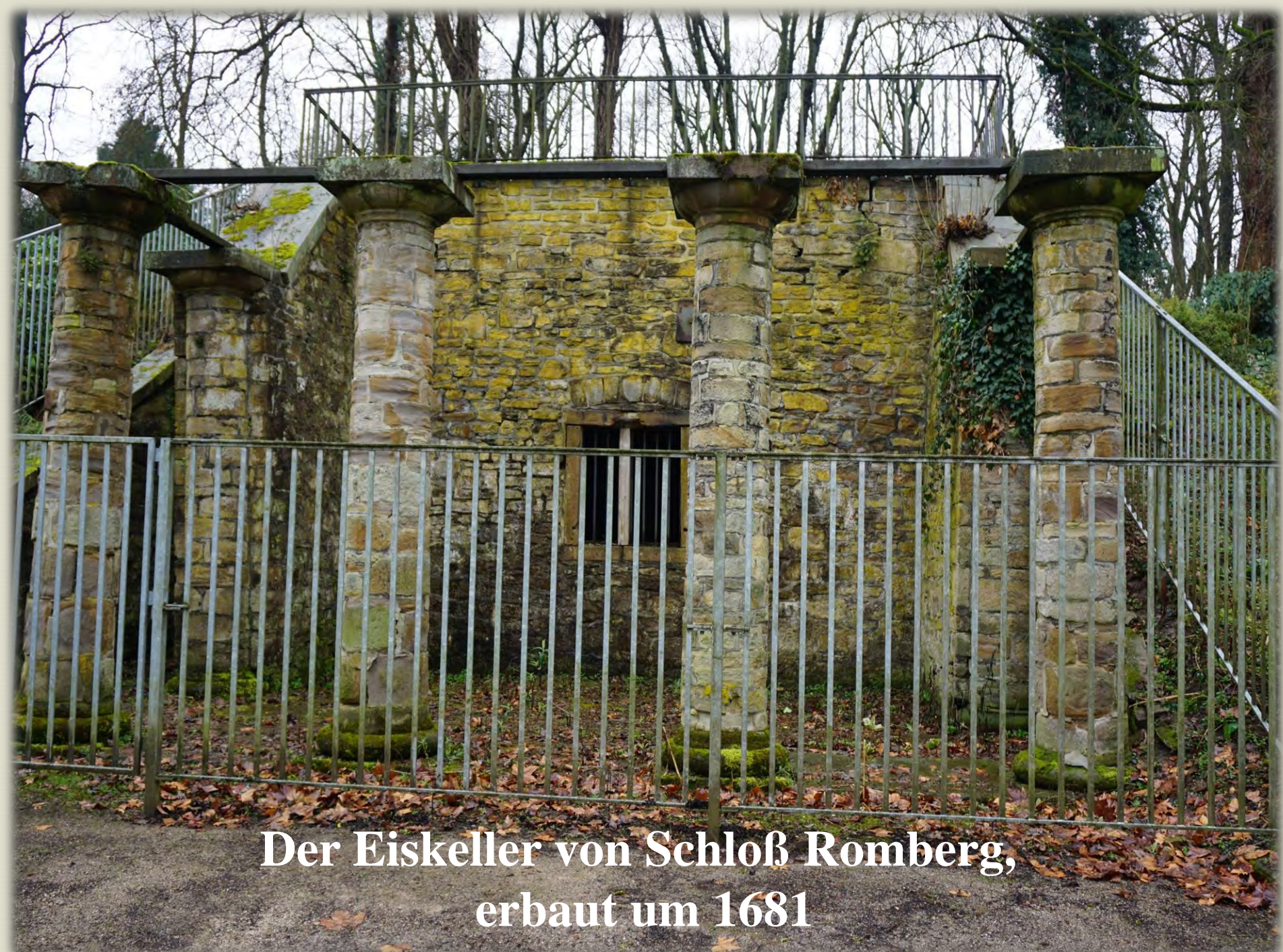
Der Eiskeller von Schloß Romberg, erbaut um 1681