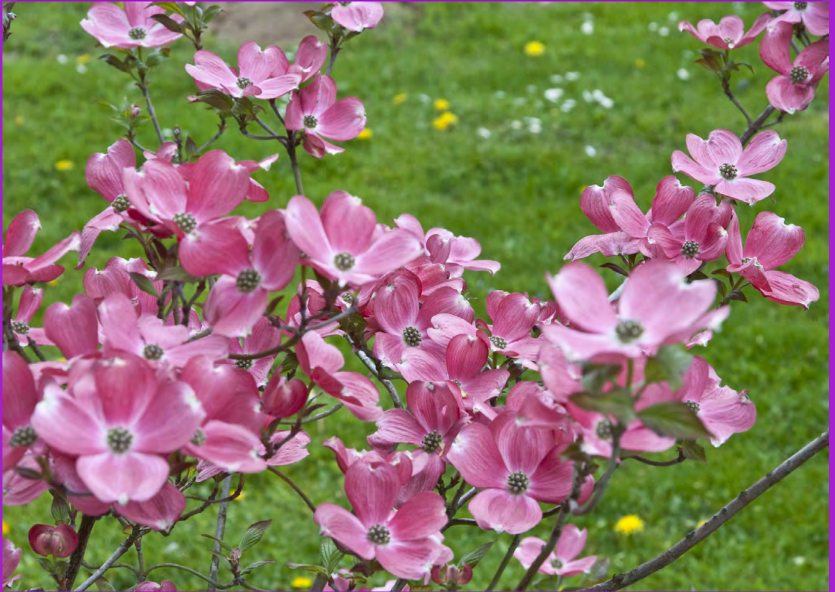
Die Blüten eines Blumen-Hartriegel (Cornus)